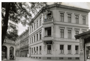
Blick in die Steinstraße (Ecke Renteistraße) Richtung Westen. Das Haus Steinstraße 7 schließt links an das Eckhaus Renteistraße 28 an.