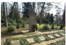
Gedenkstein und Grabsteine für die inzwischen 14. Opfer des Nationalsozialismus auf dem Sennfriedhof.