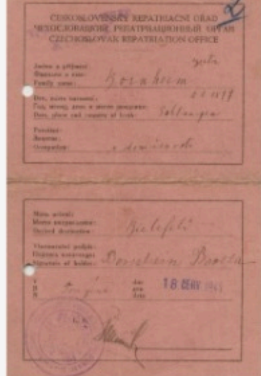
Entlassungsausweis aus dem Ghetto Theresienstadt für Bertha Bornheim.

Veröffentlicht am 30. Dezember 2025 und aktualisiert am 15. Januar 2026